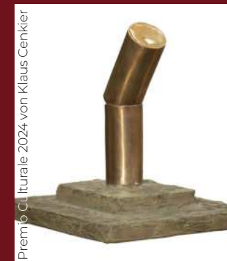
Premio Culturale 2024 von Klaus Cenkl