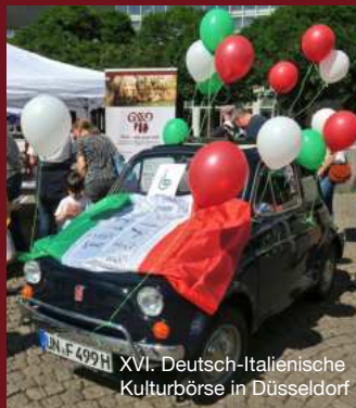
XVI. Deutsch-Italienische Kulturbörse in Düsseldorf