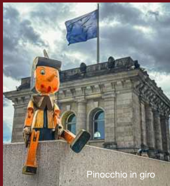
Pinocchio in giro