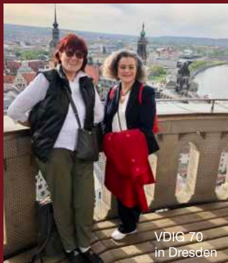
VDIG 70 in Dresden